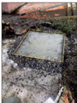
Foto No. 9. Nivelación a ras de piso