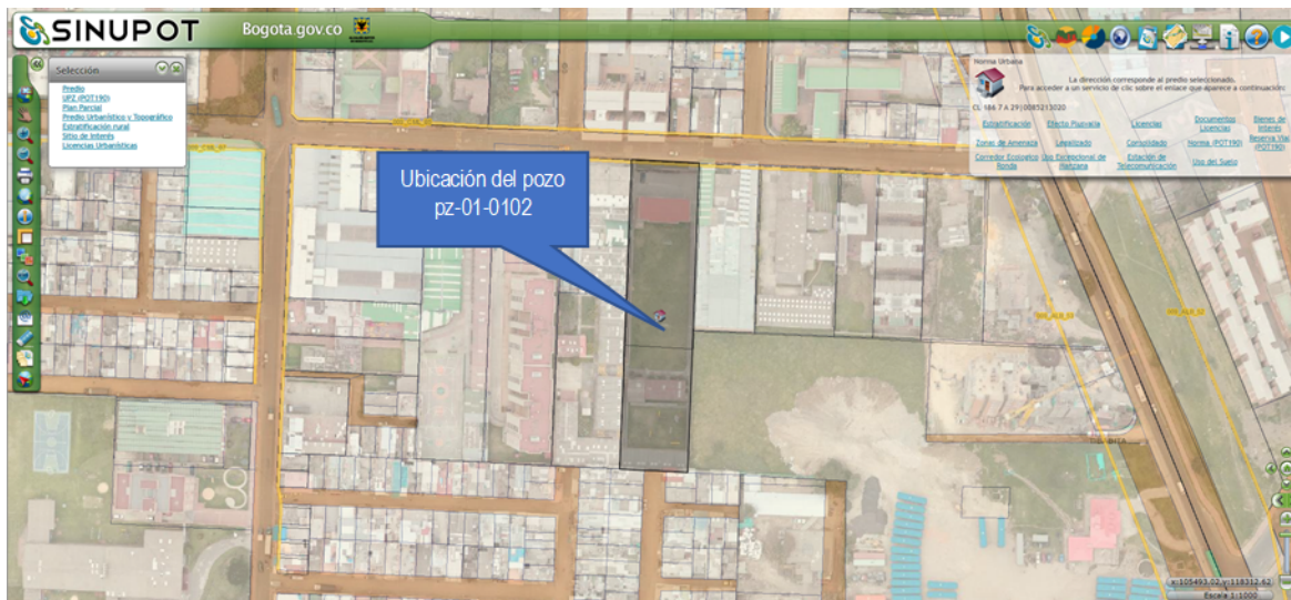
Imagen No. 2. Ubicación cartográfica del pozo

Mediante las herramientas SINUPOT y VISOR GEOGRÁFICO AMBIENTAL, se identificó que el predio donde se ubica el pozo objeto de evaluación, no se encuentra dentro las zonas correspondientes a Corredor Ecológico, Ronda Hidráulica y Zona de Manejo y Preservación Ambiental, establecidas en el Decreto 190 de 2004 (ver Imagen No. 2).