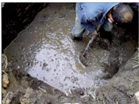
Foto No. 7. Impermeabilización del área