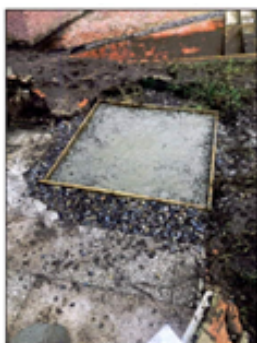
Foto No. 9. Nivelación a ras de piso