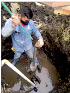
Foto No. 3. Relleno con grava