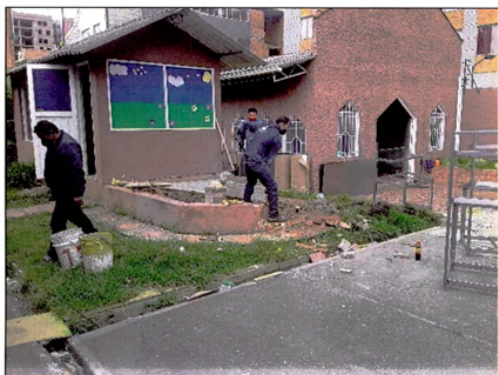
Foto No. 1. Demolición de la piletta

A la fecha de proyección del presente Concepto Técnico, el usuario remitió el informe de actividades ejecutadas durante el sellamiento definitivo bajo el radicado SDA No. 2021ER214389 del 05/10/2021, con el fin de darle cumplimiento al requerimiento No. 2021EE167119 del 11 de agosto de 2021. Dentro de la documentación mencionada, se encuentra el registro fotográfico de las mismas con su respectiva descripción, tal y como se muestra a continuación.