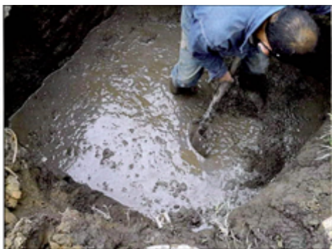
Foto No. 7. Impermeabilización del área