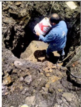
Foto No. 5. Relleno alrededor del pozo