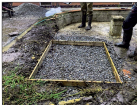
Foto No. 8. Formaleta de sellamiento