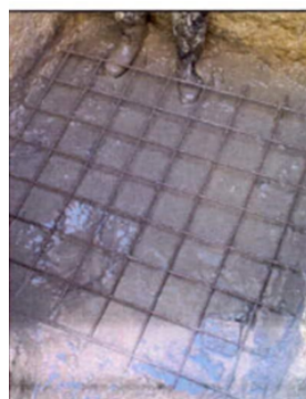
Foto No. 6. Refuerzo malla