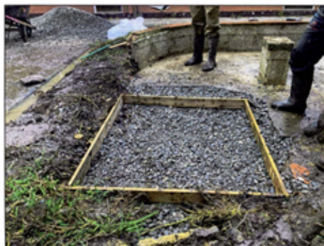
Foto No. 8. Formaleta de sellamiento