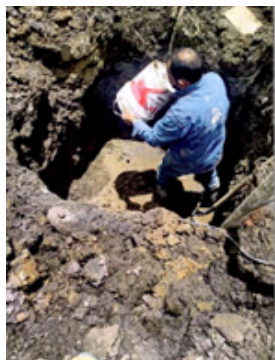
Foto No. 5. Relleno alrededor del pozo