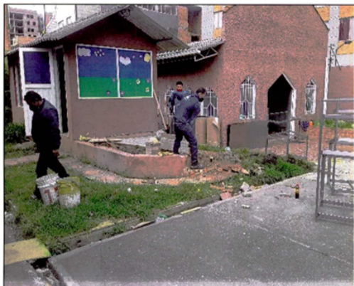
Foto No. 1. Demolición de la pileta

A la fecha de proyección del presente Concepto Técnico, el usuario remitió el informe de actividades ejecutadas durante el sellamiento definitivo bajo el radicado SDA No. 2021ER214389 del 05/10/2021, con el fin de darle cumplimiento al requerimiento No. 2021EE167119 del 11 de agosto de 2021. Dentro de la documentación mencionada, se encuentra el registro fotográfico de las mismas con su respectiva descripción, tal y como se muestra a continuación.