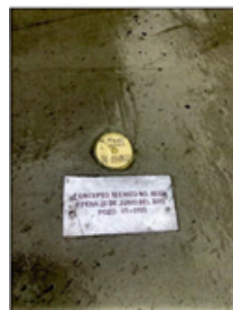
Foto No. 10. Placa de identificación