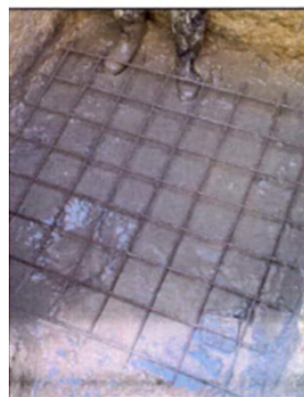
Foto No. 6. Refuerzo malla