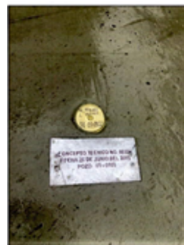
Foto No. 10. Placa de identificación

A la fecha, el pozo pz-01-0102 se encuentra sellado de manera definitiva en cumplimiento de la Resolución No. 1130 del 09/06/2020.