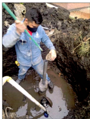
Foto No. 3. Relleno con grava